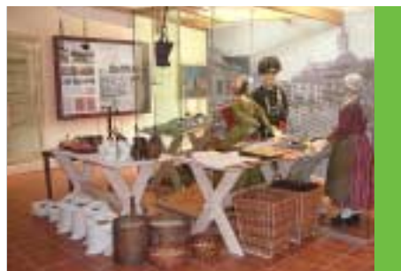
Dokončena rekonstrukce městského muzea - otevřeno Centrum Bohuslava Martinů