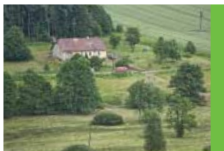
Hájekna města v Pusté Rybné propůjčena ochráncům přírody (ČSOP), kteří zahájili její údržbu s možností jejího zprovoznění pro pobyty dětí a mládeže