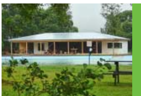
Nová budova koupaliště a rozšíření služby (více laviček, houpačka, pingpong, rozšíření beachvolejbalového hřiště)