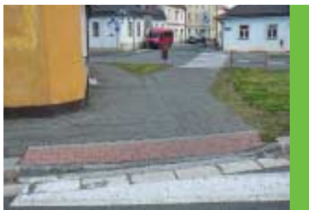
Opravené nájezdy na chodníky pro pohodlný pohyb městem (desítky nových nájezdů),

Díky spolupráci a porozumění s kolegy z ostatních stran a uskupení i s aktivními občany města se podařilo řadu námětů realizovat a jsme rádi, že jsme mohli Poličce takto prospět.