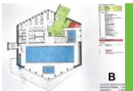
Prováděcí projektová dokumentace pro zatraktivnění plaveckého bazénu o tobogán, brouzdaliště, bazének, parní saunu, vířivku