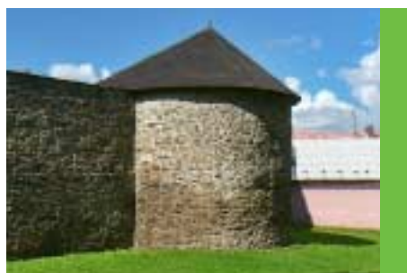
Pokračování rekonstrukce městských hradeb při ulici Čs. Armády na valech a při ulici Saffova