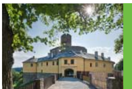
Zahájena viditelná obnova a rekonstrukce hradu Svojanov