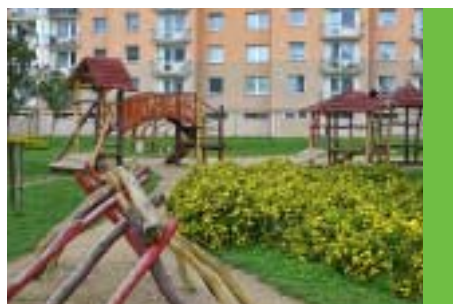
Oprava a údržba dětských hřišť např. na sídlišti Hegerova