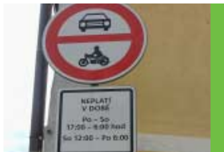
Vytvořena podmínka pro zklidnění dopravy v centru města - zpoplatněný vjezd