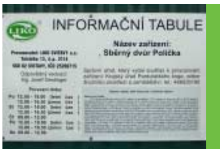
Delší provozní doba recyklačního dvora (5 dní v týdnu) a v centru větší koše na odpady létající po ulicích