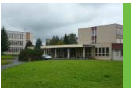
Podpora využívání obnovitelných zdrojů a úspor energie - dotace z programu OPŽP na zateplení 2 mateřských škol a ZŠ Na Lukách