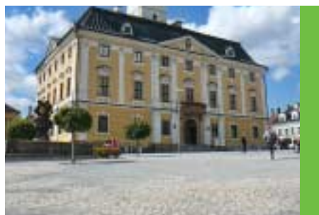
Vytvořeny podmínky pro nastartování první etapy předláždění náměstí, vlastní realizace